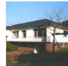
SITUATION AVANT TRAVAUX