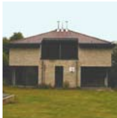
SITUATION AVANT TRAVAUX