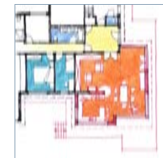
PROJET - ESQUISSE