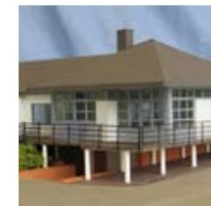
PROJET - MAQUETTE