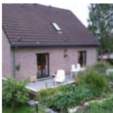
SITUATION AVANT TRAVAUX

Pour autant que l'ensemble des paramètres de votre projet nous semblent réalistes et que vous soyez intéressés par notre approche, le travail de recherche peut débuter après la signature de la convention relative à la mission R de la R.A.C.E.