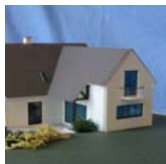
PROJET - MAQUETTE